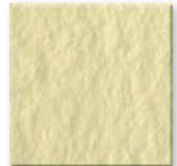
Parchment N011 Slate