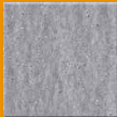
Graphite N003 Slate SB