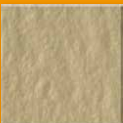
Pewter N247 Slate