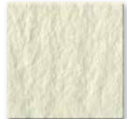
Alabaster N010 Slate