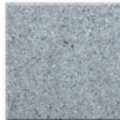
Graphite N003 Glad SB