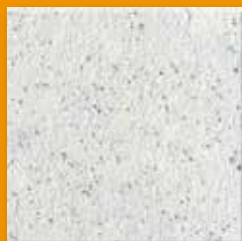
Rye N025 Glad SB