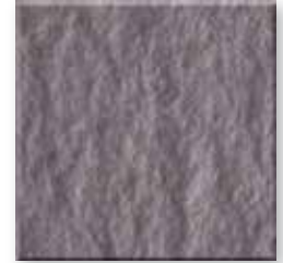
Heather N002 Slate