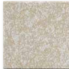
Light Stone N009 Glad SB