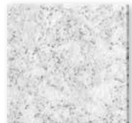
Dover N026 Glad SB