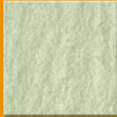
Jade N001 Slate SB