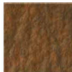
Russet N598 Slate