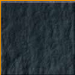
Graphite N003 Slate