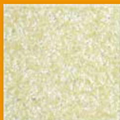
Arizona N554 Glad SB