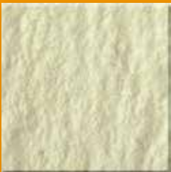
Light Stone N009 Slate