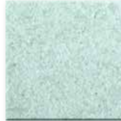
Jade N001 Glad SB