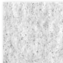
Dover N026 Slate SB