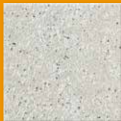
Mocha N022 Glad SB