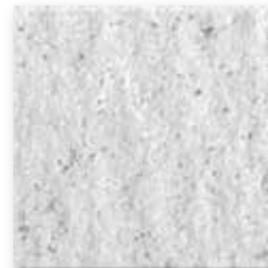
Ash N023 Slate SB