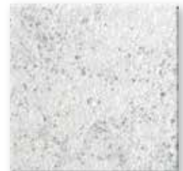
Ash N023 Glad SB