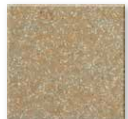
Russet N598 Slate SB