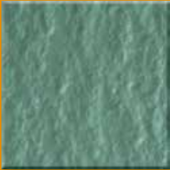
Jade N001 Slate