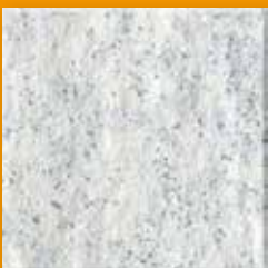
Rye N025 Slate SB