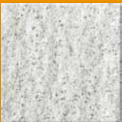
Mocha N022 Slate SB