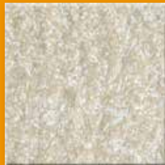
Light Stone N009 Slate SB