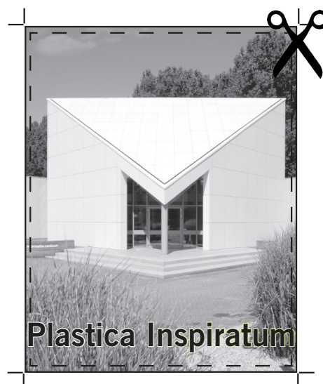
Fout: geen overloop en de tekst is te dicht tegen de rand geplaatst