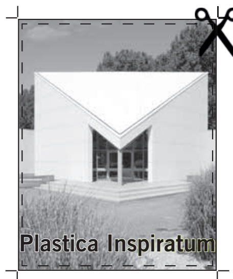
Fout: geen overloop en de tekst is te dicht tegen de rand geplaatst